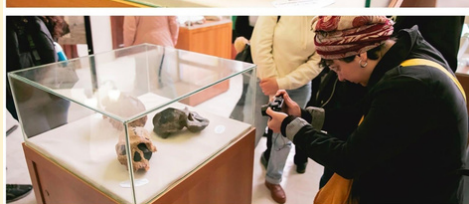
Abertura de exposição realizada pelo CEPA