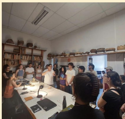
Visita de turma ao espaço físico do CEPA

Além disso, desde 2012, o CEPA é ligado diretamente ao DEAN e conta com um valioso acervo passível de consulta a partir de contato prévio. Suas atuais ações podem ser desfrutadas por discentes do curso de Ciências Sociais por meio de cursos de extensão, palestras, exposições e pesquisas. Importante também ficar atente à possibilidade de atuação, de forma voluntária ou como bolsista, em alguns de seus projetos!