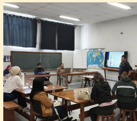
Palestra realizada no espaço físico do CEPA

Sob coordenação do professor Fábio Parenti (DEAN), o CEPA é localizado na Rua Bom Jesus, 650, no campus Juvevê e funciona de segunda à sexta das 8h às 17h. Para um conhecimento aprofundado de suas atividades acesse: http://www.humanas.ufpr.br/portal/cepa/ ou acompanhe o instagram @cepaufpr.