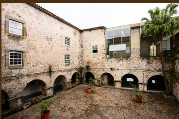
MAE UFPR - Paranaguá.

Suas ações são amplas e vão desde exposições (virtuais, didáticas, temporárias, etc.), publicações acadêmicas, ações educativas com jogos e caixas didáticas, visitas guiadas e projetos de ensino, pesquisa e extensão. Também é realizada a seleção de bolsistas para estágio e projetos de extensão.